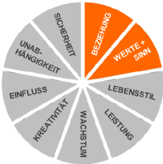
IHRE ZENTRALEN MOTIVE BEZIEHUNG UND WERT